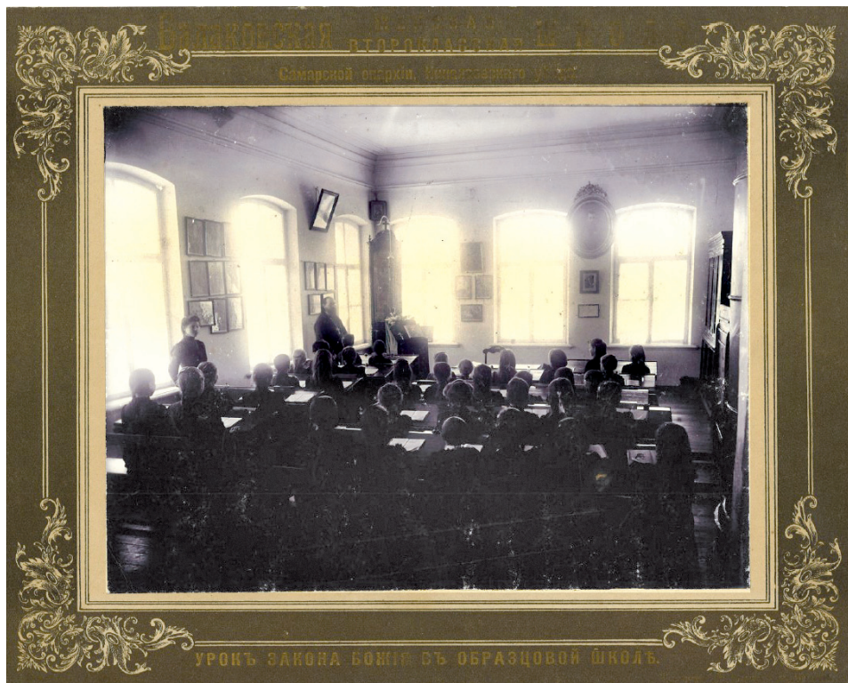
Урок Закона Божьего во Второклассной женской учительской школе. Январь 1909 года