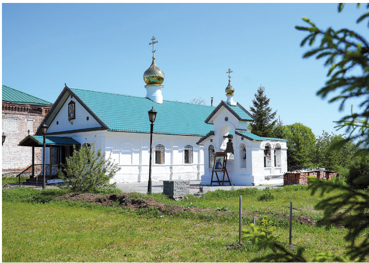
Храм апостола Иоанна Богослова Иргизского Воскресенского мужского монастыря с. Криволучье Балаковского района