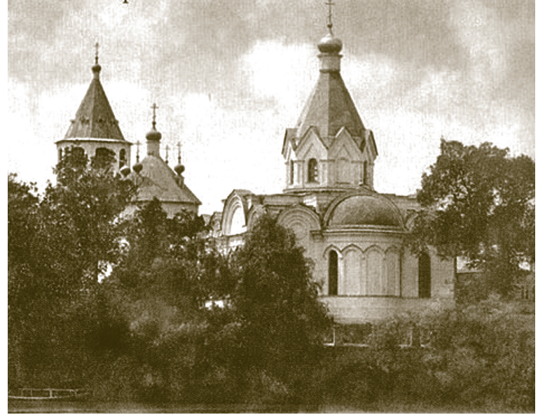
Храм в честь Рождества Пресвятой Богородицы Иргизского Воскресенского мужского монастыря. Начало XX века