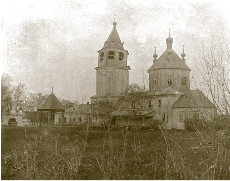
Храм в честь Воскресения Христова Иргизского Воскресенского мужского монастыря. 1917–1918 годы

Беседовала Наталья САХАРОВА