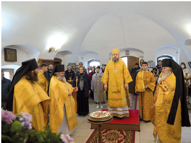
Престольный праздник храма апостола Иоанна Богослова Иргизского Воскресенского мужского монастыря. 9 октября 2024 года