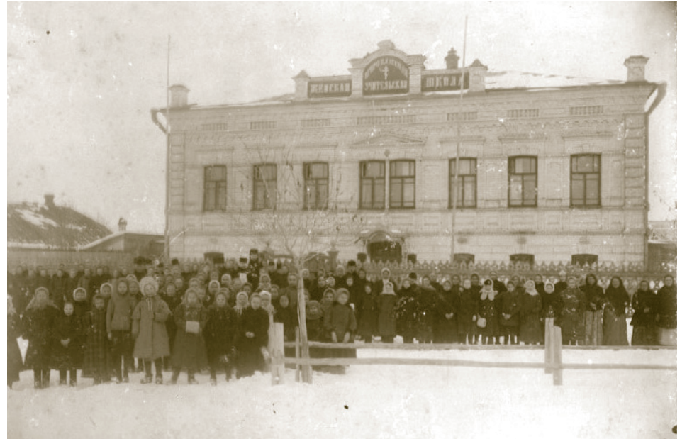
Воспитанницы и педагогический состав у здания Поликарповской школы. Январь 1909 года

В августе 1913 года решением Училищного совета при Святейшем Синоде по ходатайству Самарского училищного совета было разрешено «в виде опыта» при Балаковской второклассной женской школе открыть дополнительный одногодичный учительский класс, чтобы окончившие курс второклассной школы ученицы имели возможность