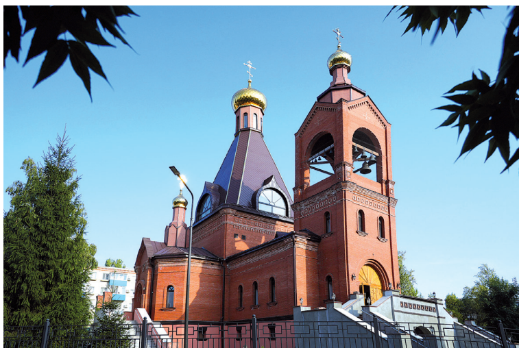
Храм апостола Иоанна Богослова г. Балаково

Современный приход Иоанно-Богословского храма начал организовываться с 2005 года в третьем микрорайоне города по адресу: Набережная Леонова, 30. Сначала богослужения