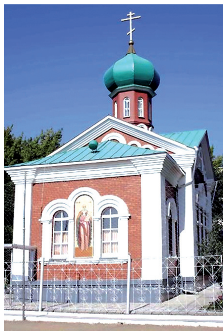
Храм святого пророка Божия Или на территории ИК-4