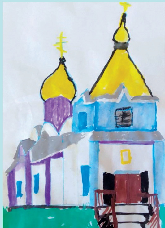
Акназаров Артём, 10 лет