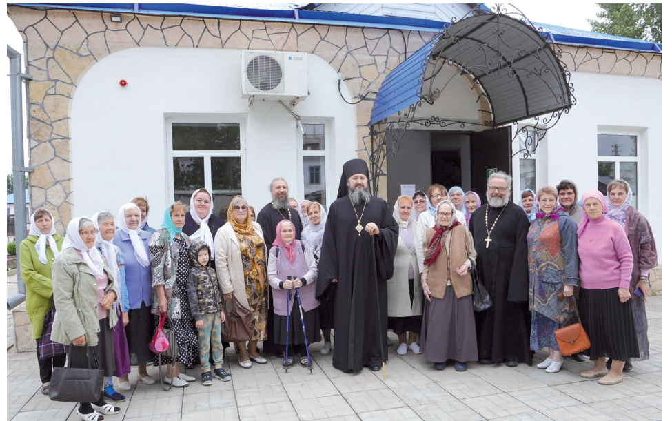
Архиерейское богослужение в храме п. Заволжский. 25 июня 2023 года