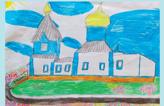
Шальнов Ваня, 8 лет