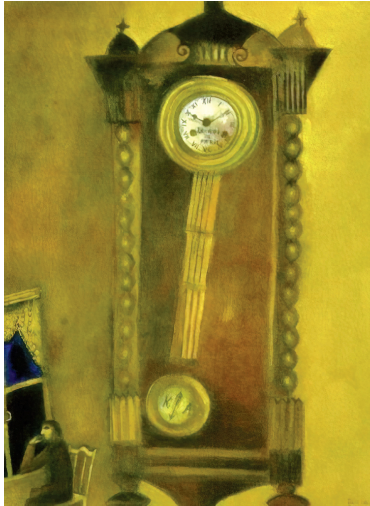
Марк Шагал «Часы». 1914 год

«Екклесиаст» — одна из самых небольших книг Ветхого Завета. Текст состоит всего из 12 глав, разделенных на разное количество стихов — от 12 до 29. Исследователи выделяют 6 тем, которые рассматривает автор: Бог-Творец и отношение к Нему людей, труды и заботы, богатство и бедность, счастье и наслажде-