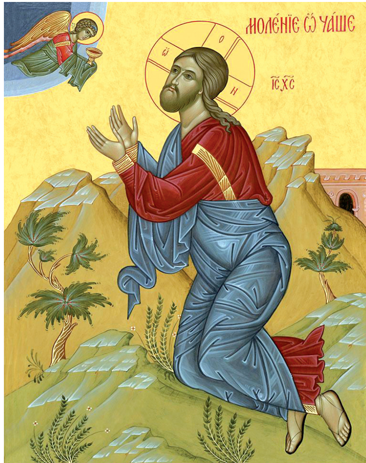
Икона «Моление о Чаше»

Следует отличать усилия Христа в следовании воле Божией от нашего противления греху. Христос, имея чистую природу, был подвержен естественным неукоризненным страстям. Преподобный Иоанн Дамаскин пишет: «Природные же и непредсудительные страсти суть не находящиеся в нашей власти, которые вошли в человеческую жизнь из-за осуждения за преступление, как, например, голод, жажда, утомление, труд, слезы, тление, уклонение от смерти, боязнь, предсмертная мука (от которой пот и капли крови)». Хрис-