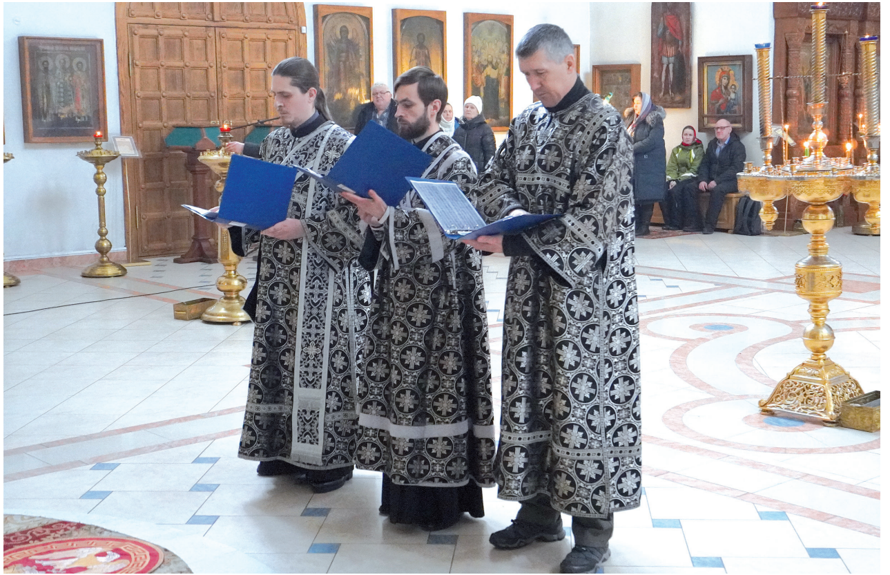
Певчие исполняют 140-й псалом во время Литургии Преждеосвященных Даров. Свято-Троицкий кафедральный собор г. Балаково

По-разному толкуют экзегеты заключительные слова восьмого стиха «...не отыми душу мою». Так, например, византийский богослов Евфимий Зигабен понимает их буквально и объясняет так: «Очи, говорит (псалмопевец. — Л.Д.), души моей взирают на Тебя, Господи: потому что я всего себя возлагал