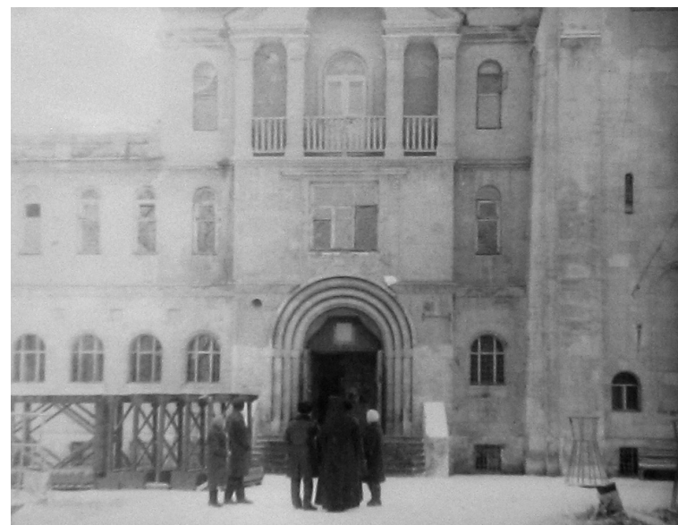
Архиепископ Пимен у Свято-Троицкого храма г. Балаково. Фото предоставлено Валерием Тепловым (первая публикация)

в 14 часов 30 минут. Настоятеля нет, и никто не знает, где он. Ходил полчаса по двору, промерз, потом зашел в храм (речь идет о Свято-Троицком кафедральном соборе г. Балаково. — Авт. ), смотрел, как оборудовали главный алтарь. Много сдвигов [...]. Служил в 17 часов всенощную. В основном все прошло хорошо. Было три казака, заместитель мэра и другие. Народу около 500 человек [...].