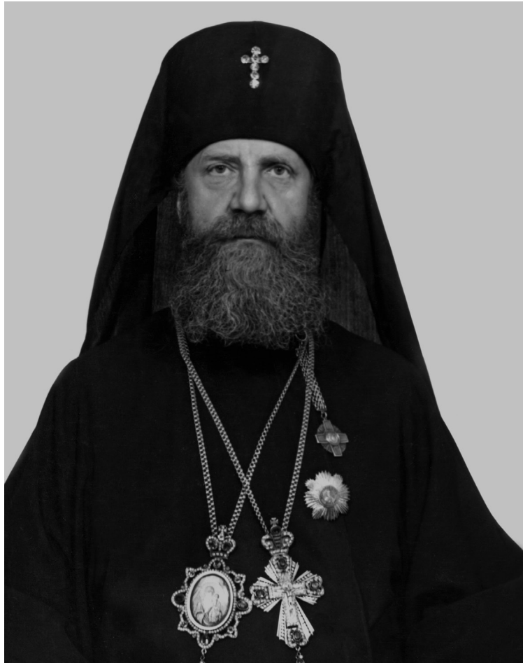
Архиепископ Саратовский и Вольский Пимен (Хмелевский)

На территории огромной тогда Саратовской и Волгоградской епархии в 1965 году насчитывалось всего 21 действующий