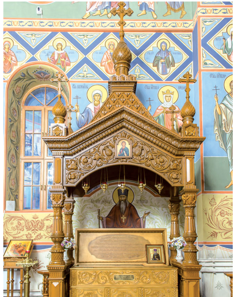
Рака с мощами святого праведного Александра Чагринского в самарском Иверском монастыре

22 июня 2000 года честные мощи протоиерея Александра Юнгера были перенесены в Иверский женский монастырь города Самары, где были положены в раку в соборном храме обители, а 15 октября