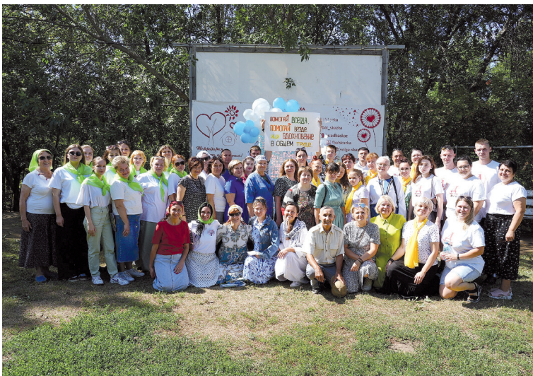
Волонтеры Балаковской епархии

носить плода сама собою, если не будет на лозе: так и вы, если не будете во Мне. Я есмь лоза, а вы ветви; кто пребывает во Мне, и Я в нем, тот приносит много плода; ибо без Меня не можете делать ничего (Ин. 15, 4–5).