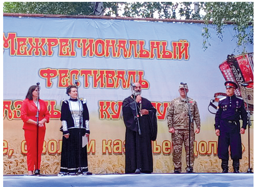
Межрегиональный фестиваль казачьей культуры «О вере, о воле и казачьей доле!». 9 августа 2024 года