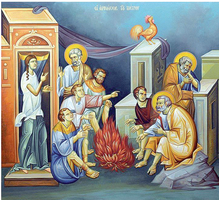
Икона «Отречение апостола Петра»

Молитва Иисусова имеет громадное значение в жизни христианина. Это есть кратчайший путь к достижению Царствия Небесного, хотя этот путь долгий,