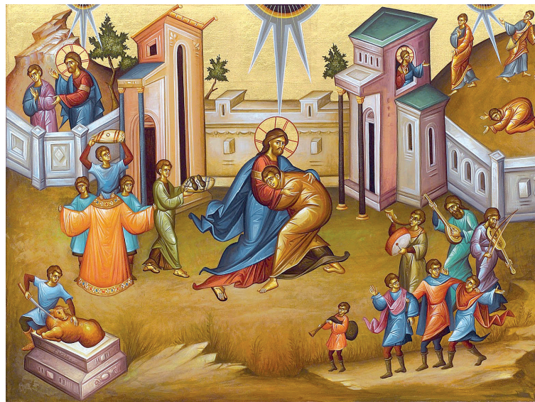
Икона «Притча о блудном сыне»

Является вопрос: где ключ для открытия духовных радостей? На это ответ один: в молитве Иисусовой. Великую силу имеет эта молитва. И степени она имеет разные. Самая первая — это произнесение слов «Господи Иисусе Христе, Сыне Божий, помилуй мя, грешного». На высших степенях она достигает такой силы, что может и горы переставить. Этого, конечно, не всякий может достигнуть, но произносить слова «Господи Иисусе Христе, Сыне Божий, помилуй мя» каждому нетрудно, а польза громадная, это сильнейшее оружие для борьбы со страстями. Одна, например, горда, другую одолевают блудные мысли — кажется, и мужчин не видит, а все мысль блудит, третья завистлива, а бороться нет сил, где взять их? Единственно в Иисусовой молитве. Враг всячески отвлекает от нее: «Ну что за бессмыслица — повторять одно и то же, когда ни ум, ни сердце не участвуют в молитве, лучше заменить ее чем-нибудь другим». Не слушайте его: жлет... Продолжайте упражняться в молитве, и она не останется бесплодной... Все святые держались этой молитвы, и она становилась им так дорога, что они ее ни на что не променяли бы. Когда их ум был отвлекаем чем-нибудь другим, они томилась и стремились опять начать молитву. Их стремление было похоже на желание человека жаждущего, например, после соленой пищи утолить