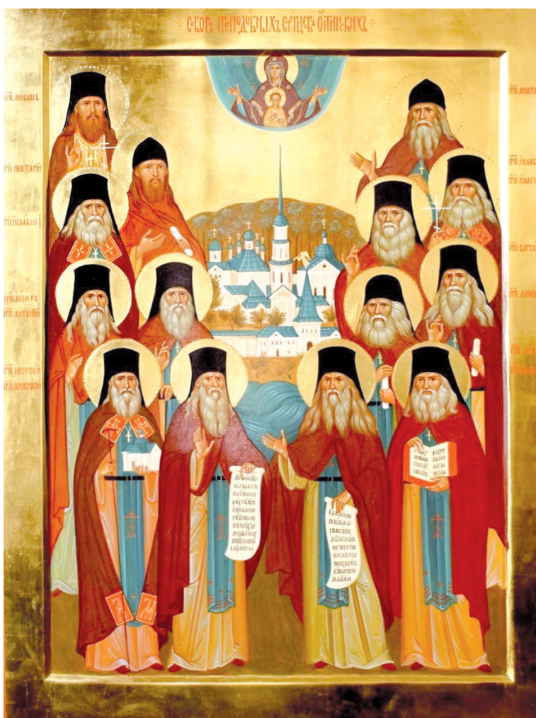
Икона «Собор Оптинских старцев»

Подготовила Наталья САХАРОВА по материалам интернет-портала «Правмир» (www.pravmir.ru) и книги «Святые отцы об Иисусовой молитве» (сост. Н. Золотухина. М.: Благовест, 2014)