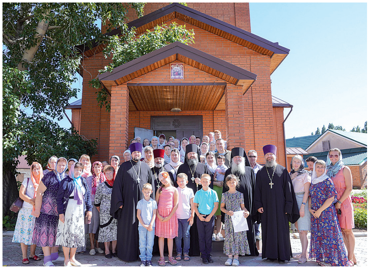
Престольный праздник храма во имя пророка Божия Илии р.п. Духовницкое. 2 августа 2022 года