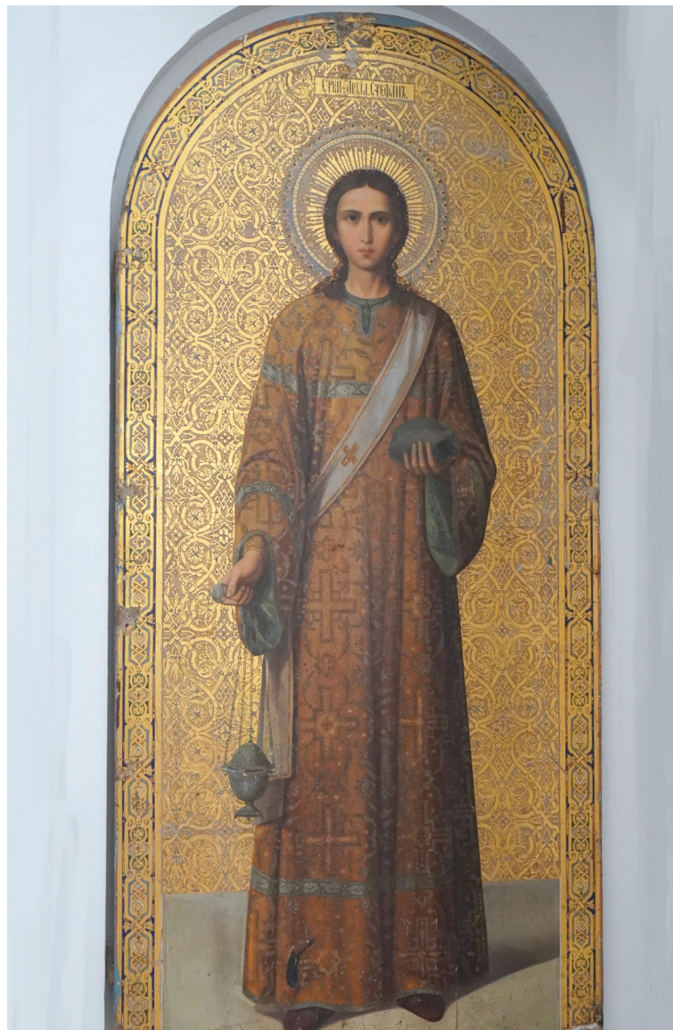
Первомученик архиерей Стефан. Архиерейское подворье — храм Покрова Пресвятой Богородицы с. Липовка Духовницкого района