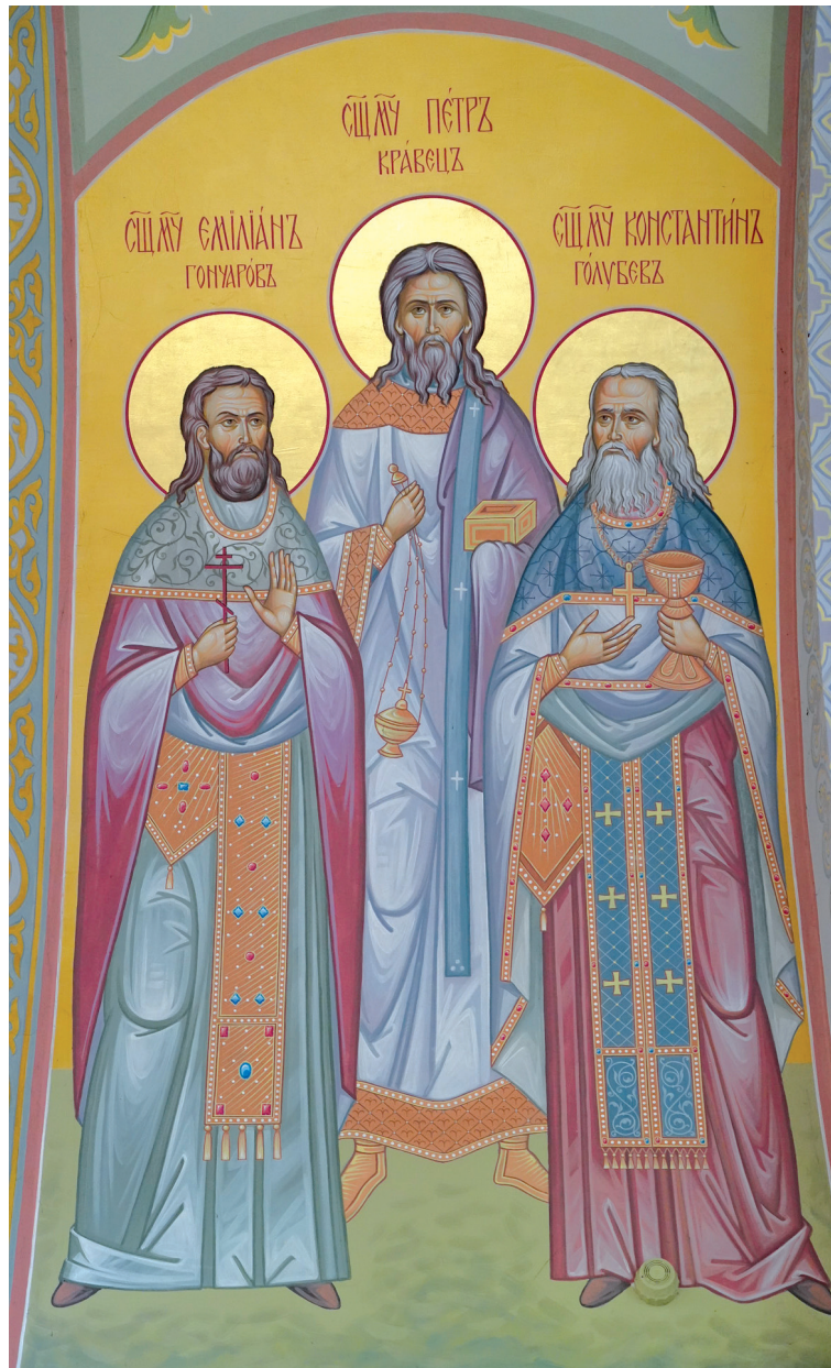
Фрагмент росписи храма святого праведного Иоанна Кронштадтского Иоанновского женского монастыря п. Алексеевка Хвалынского района. В центре — новомученик протоиерей Петр Кравец