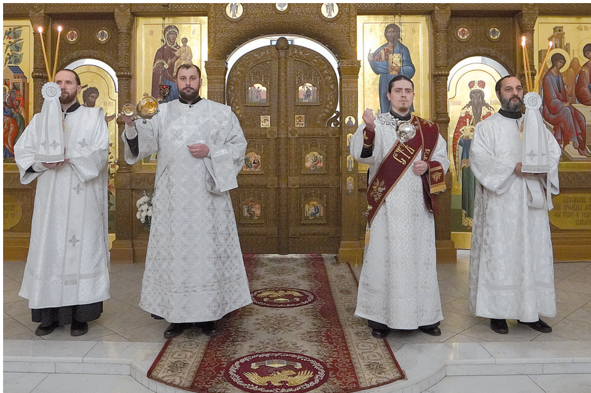
Диаконы храмов г. Балаково. Свято-Троицкий кафедральный собор г. Балаково

Сегодня в Православной Церкви диаконов — это прежде всего глашатай: он возглавляет начало богослужения — на вечернем богослужении воззванием «Восстаните!», а на Божественной литургии — призывом священника в ал-