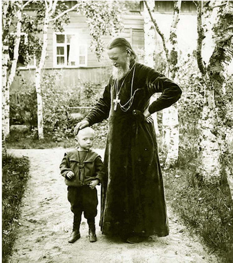
Праведный Иоанн Кронштадтский со своим крестником

он стремился приобщить всех, с кем соприкасался. Он называл учеников гимназии «своими детьми», потому что «рождал их благовествованием о Христе Иисусе» (см.: 1 Кор. 4, 15), питал их наставлениями евангельскими, как «млеком словесным». Действительно, назвать чужих детей искренне своими можно, только обладая Духом Святым, Духом Истины и Любви.