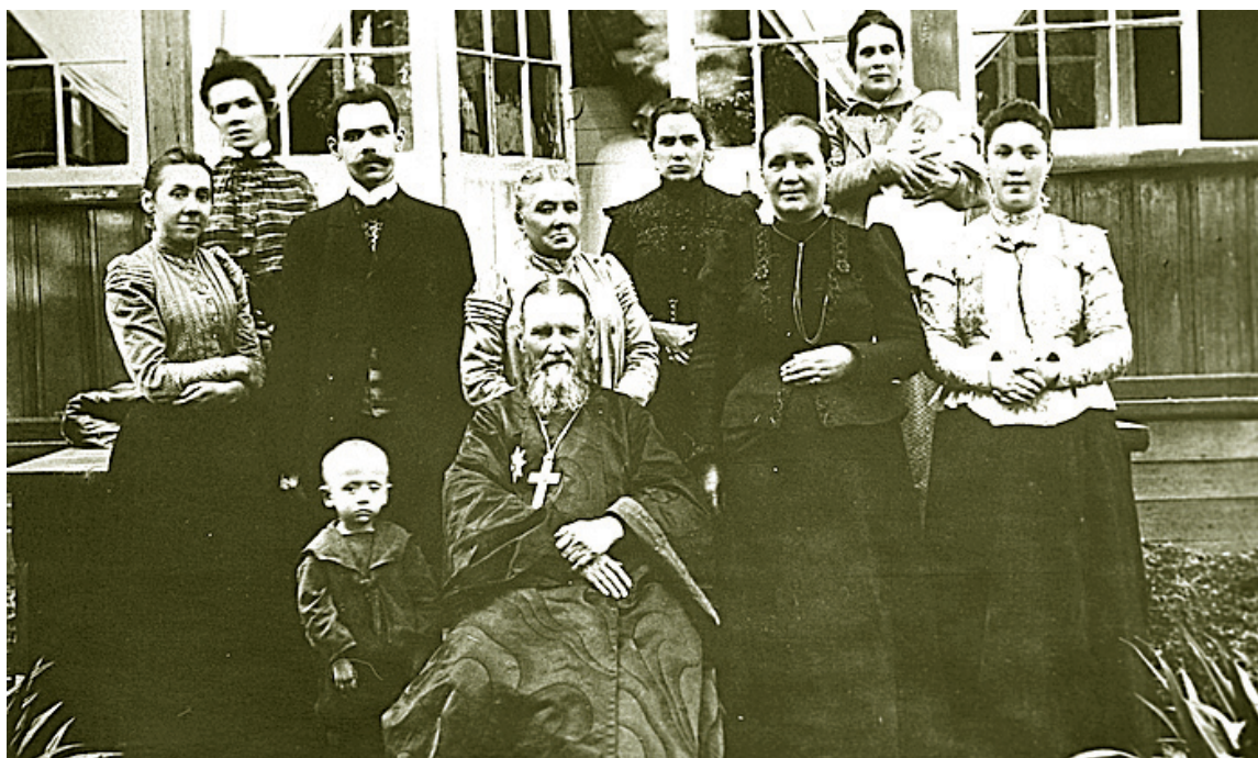
Отец Иоанн Кронштадтский в кругу семьи

Святой праведный Иоанн Кронштадтский считал, что духовные предметы