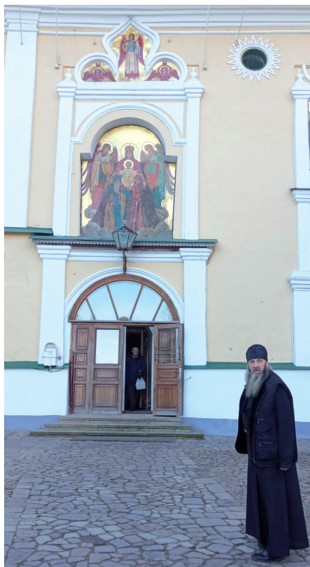
В Псково-Печерском монастыре