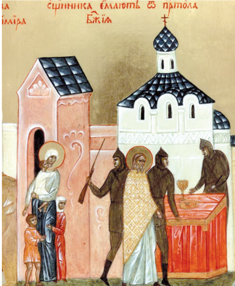
Клеймо «Арест священника в храме во время богослужения» иконы «Собор новомучеников и исповедников Церкви Русской»