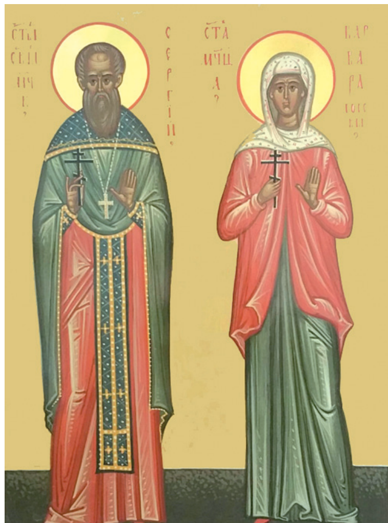
Образ священномученика Сергия и мученицы Варвары Лосевых