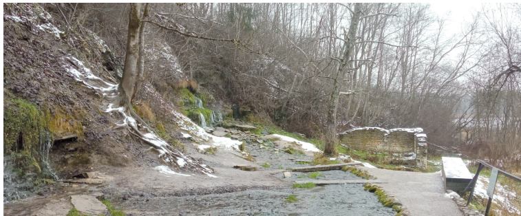
Словенские ключи в Изборске

Мы обратили внимание на установленные в стенах керамические и известняковые плиты с надписями. Как древние надгробные памятники эти керамики представляют большую художественную и историческую ценность.