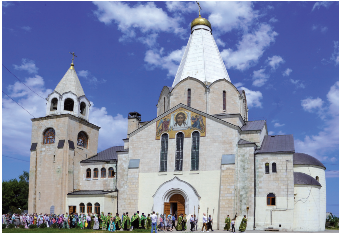
Свято-Троицкий кафедральный собор г. Балаково. 2023 год

В августе каждый год езжу служить по древнерусскому богослужебному чину в Крестовоздвиженский единоверческий храм горо-